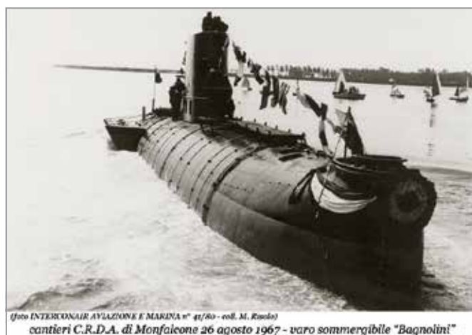
cantieri C.R.D.A. di Monfalcone 26 agosto 1967 - varo sommergibile "Bagnolini"