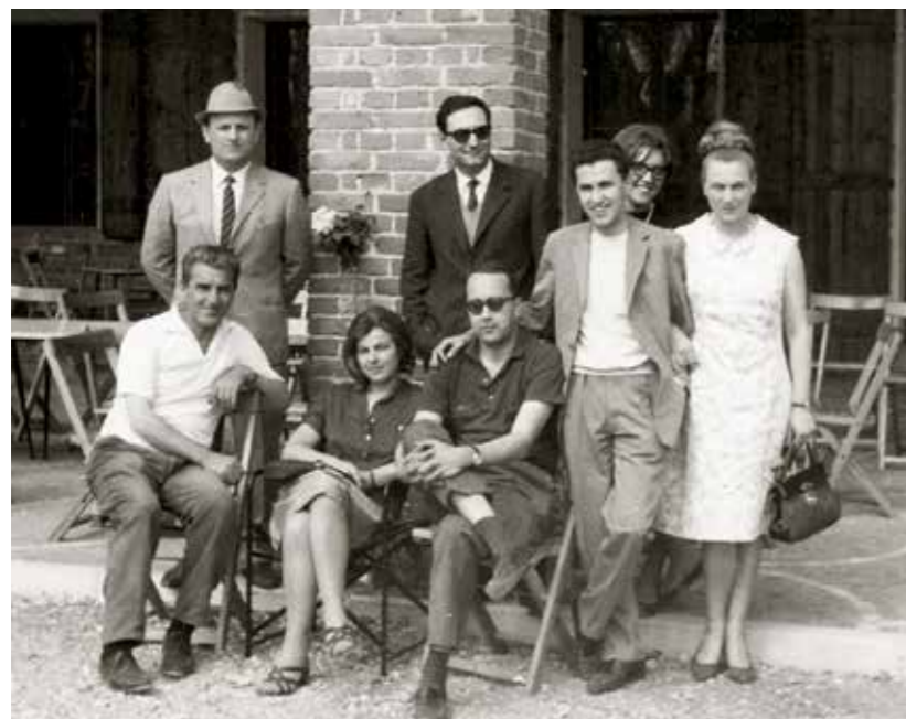
Con lo staff di Basaglia, autore della foto, all'OPP di Gorizia 1968-1970