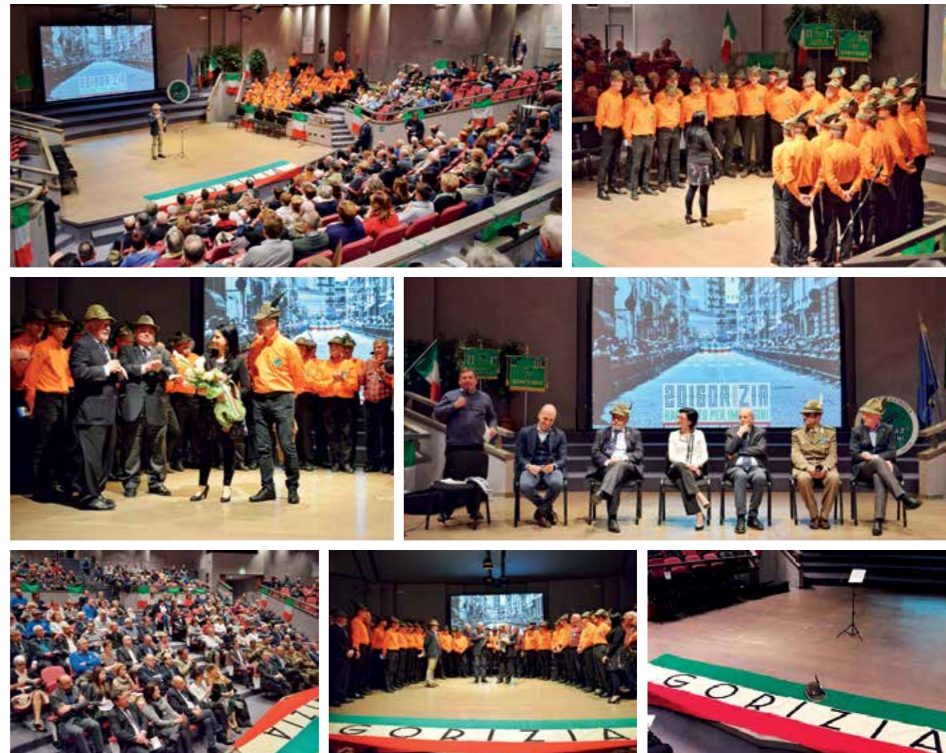
Alcuni scatti relativi alla serata del 7 aprile scorso all'Auditorium di Gorizia.