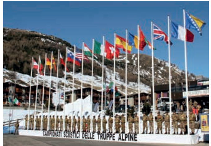
Le Bandiere delle Nazioni partecipanti ai CaSTA 2016.

Le piste saranno quelle di San Candido e dell'Alta Val Pusteria, sulle montagne più belle del mondo – le Dolomiti – che dal 13 al 19 marzo prossimo ospiteranno la manifestazione militare internazionale giunta alla 69 a edizione.