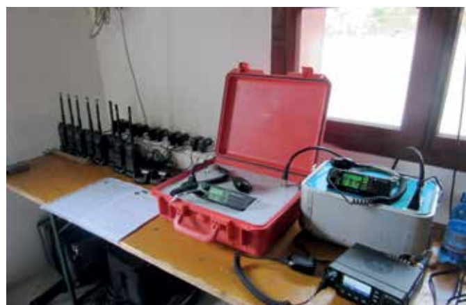
Sala Radio Comando e Controllo A.N.A.