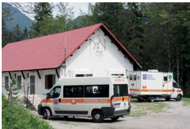
Campo Base Ex Polveriera Val Saisera