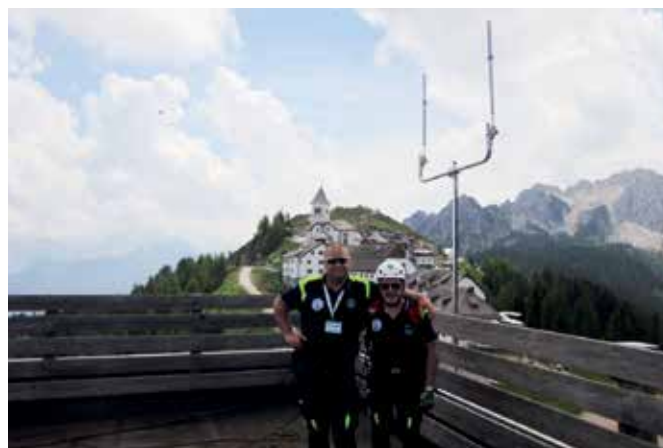
Antenne verticali posizionate sulla sommità dell'edificio arrivo impianti risalita M. Lussari

Da qui sono state effettuate delle prove di trasmissione con il Campo Base, in modalità digitale, con dei portatili ricevendo degli ottimi rapporti di ricezione.