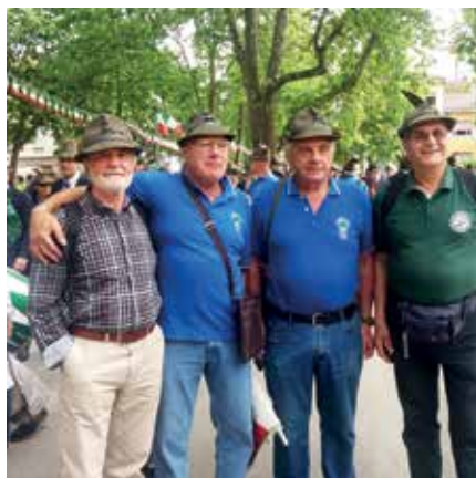
Ritratti al Raduno Triveneto di Gorizia

In occasione del centenario della Grande Guerra al sacrario di Oslavia vi è stata la consegna delle medaglie celebrative dei partecipanti al primo conflitto mondiale.