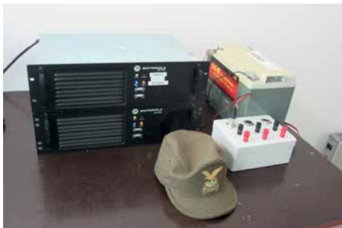
Sistemazione ponti radio con batteria tampone presso locale impianti risalita M. Lussari

I ponti radio, MOTOROLA DR3000, (Mobile 2 e RPT4) con acclusa una batteria tampone da 250 Ah, sono stati alloggiati nel locale adibito a primo soccorso provvisto di energia elettrica.