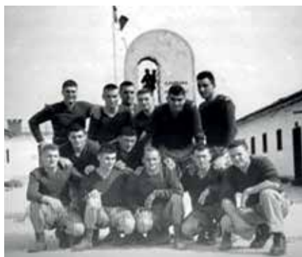
Ritratti al CAR nel 1965

Si erano conosciuti al CAR di Cividale del Friuli nel 1965 prestando poi tutti servizio al Gruppo Conegliano.