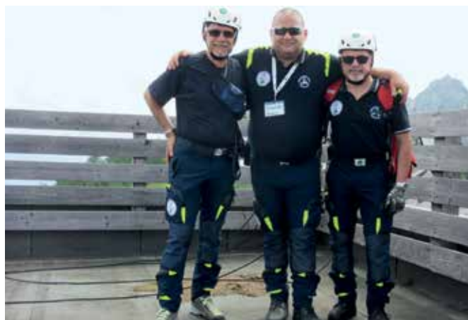
Il Coordinatore Reg. TRX ed i Referenti TRX Sezione ANA Gorizia