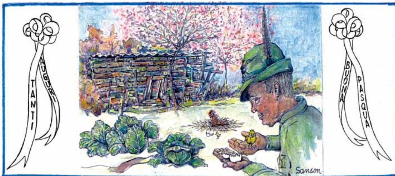
“Commozioni primaverili” Dipinto dell’artista alpino Dario Sanson.

Questo il numero di codice fiscale da indicare nella dichiarazione dei redditi: 97329810150.