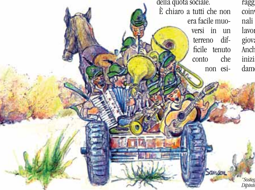
"Sostegno musicale alla scampagnata di Pasquetta" Dipinto dell'artista alpino Dario Sanson.