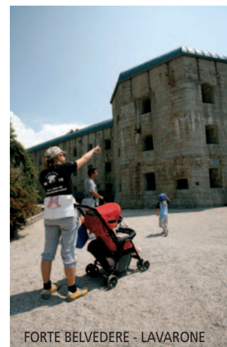
FORTE BELVEDERE - LAVARONE