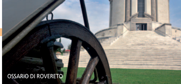
OSSARIO DI ROVERETO