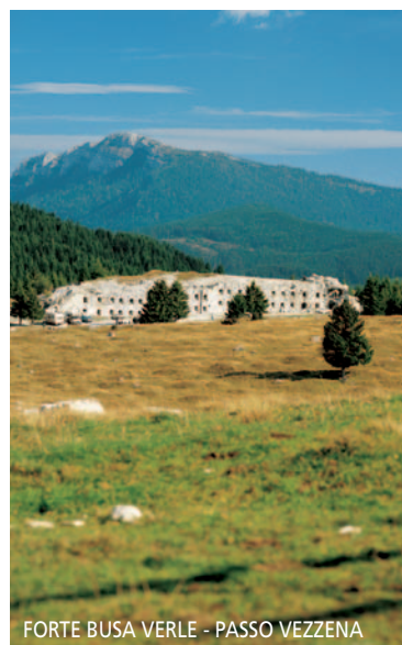
FORTE BUSA VERLE - PASSO VEZZENA