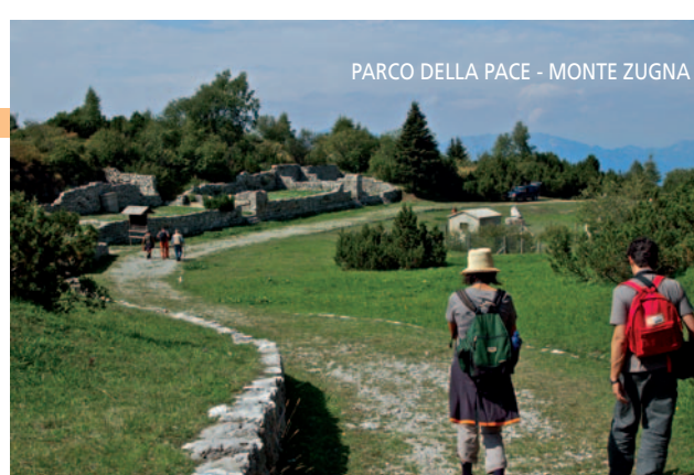
PARCO DELLA PACE - MONTE ZUGNA